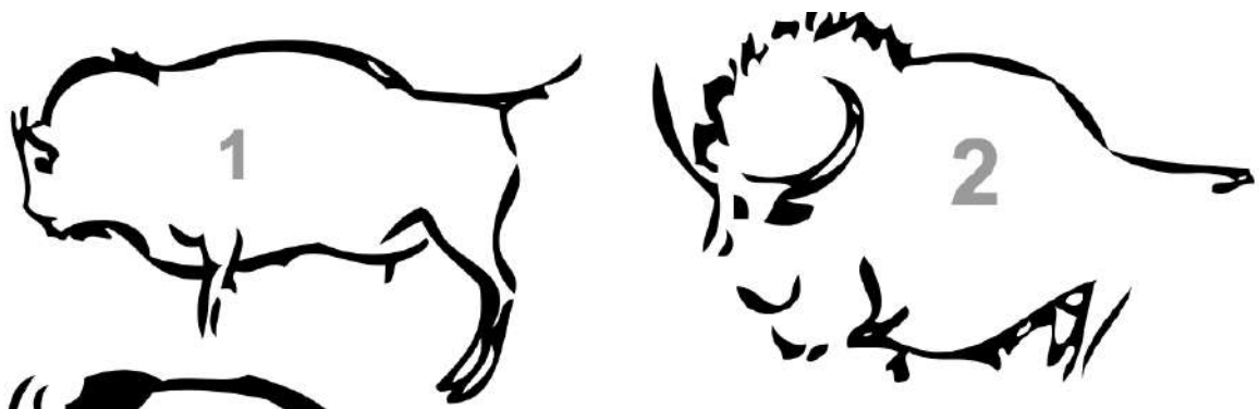
Bilder: Wisentdarstellungen aus dem Magdalénien (vor 23'000 bis 14'000 Jahren) aus Südfrankreich. 1 Wisenttyp (Grotte de Pergouset, Ardèche) und 2 Steppenbisonotyp (Grotte de Lascaux, Dordogne).

In den prähistorischen Höhlenmalereien in Südwesteuropa gibt es Wisentdarstellungen mit kurzen Hörnern und solche mit langen Hörnern (siehe Abbildung). Ausserdem haben die Künstler auch die Körperproportionen verschieden dargestellt. Es ist durch Knochenfunde gut belegt, dass über einen langen Zeitraum zwei Arten von Wisenten oder Bisons in Europa heimisch waren: der langhornige Steppenbison ( Bos priscus ) und der kurzhornige Wisent ( Bos bonasus ). Der Steppenbison kam auch in Nordamerika vor, doch ist er beidseits des Atlantiks vor mehr als 10'000 Jahren ausgestorben. Die Herkunft des Wisents blieb lange ungeklärt. Forscher um Julien Soubrier* von der Universität Adelaide in Australien haben das Rätsel mit Hilfe von genetischen Untersuchungen vor zehn Jahren gelöst: der Wisent ist vor rund 120'000 Jahren aus Kreuzungen männlicher Steppenbisons mit weiblichen Auerochsen («Auerkühen») hervorgegangen. Unsere Wisente sind bezüglich Körper- und Horngrösse zwar etwas weniger imposant als ihre Vorfahren, aber sie haben anders als jene immerhin bis heute überlebt.