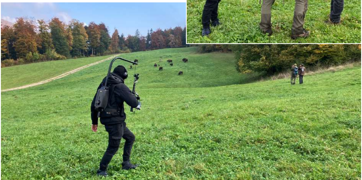
Fotos von den Dreharbeiten für Minute NATURE.