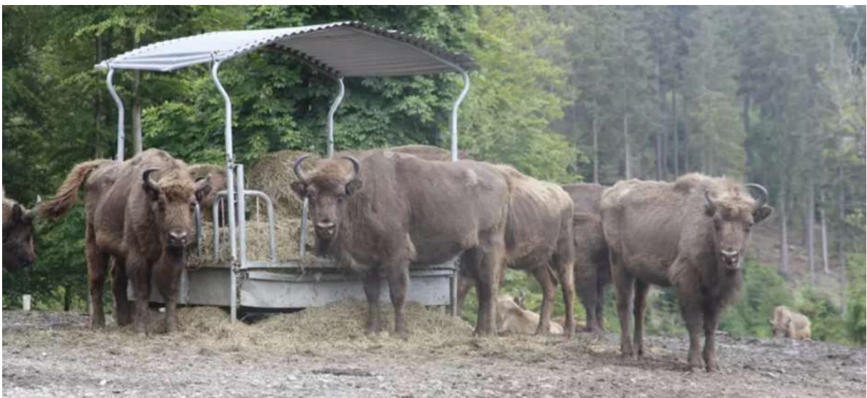
Die eingezäunte Wisentherde vom Rothaargebirge.

Das Projekt Wisent Thal war von Anfang an in engem Kontakt mit dem Projekt im Rothaargebirge. Gerade wegen der dortigen Akzeptanzprobleme mit (einigen wenigen) Privatwaldbesitzern wurde das Projekt im Thal anders angepackt: vor einer Auswilderung soll während 10 Jahren unter kontrollierten Bedingungen Akzeptanz geschaffen werden. Dies ist eines der Hauptziele des Projektes Wisent Thal. Die «Schäden» im Wald sollen von den betroffenen Waldeigentümern beurteilt und in Relation zu anderen Schäden und Problemen im Wirtschaftswald bewertet werden. Nur wenn solche «Schäden» als tragbar beurteilt werden, kann es später zu einer Auswilderung der Wisente im Jura kommen. Übrigens ist die Akzeptanz der Wisente auch im Rothaargebirge gesamthaft sehr gut; es sind nur wenige Eigentümer von kleinen Privatwaldstücken, die gegen die Wisente geklagt haben, obwohl der geringfügige materielle Schaden, den die Wisente an ihren Bäumen angerichtet hatten, sehr grosszügig finanziell abgegolten wurde.